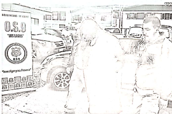
EL FALSO ABOGADO FUE DETENIDO EL VIERNES EN PUERTO MONTT POR EFECTIVOS DEL OS9 DE CARABINEROS.

Pero el caso del falso abogado deja en evidencia las deficiencias de seguridad del sistema judicial chileno, ya que G.R.R., usando una cédula de identidad adulterada (pero con su número de serie activo) y suplantando al abogado real Pa-